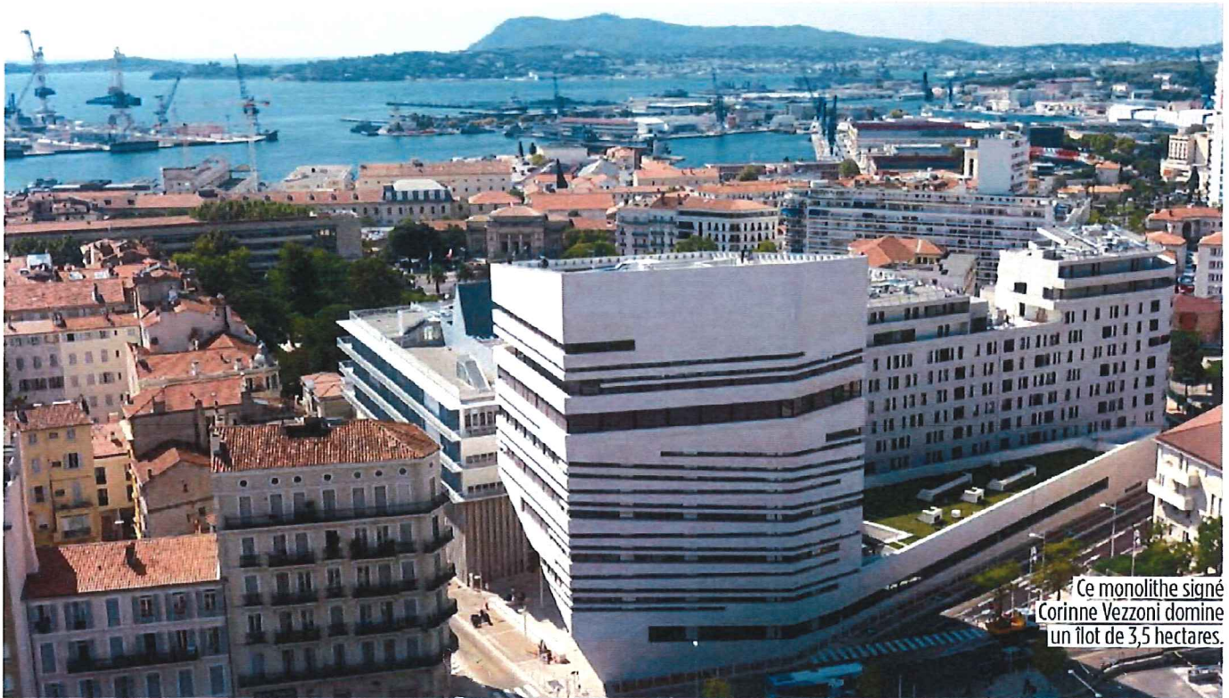
Ce monolithe signé Corinne Vezzoni domine un îlot de 3,5 hectares.