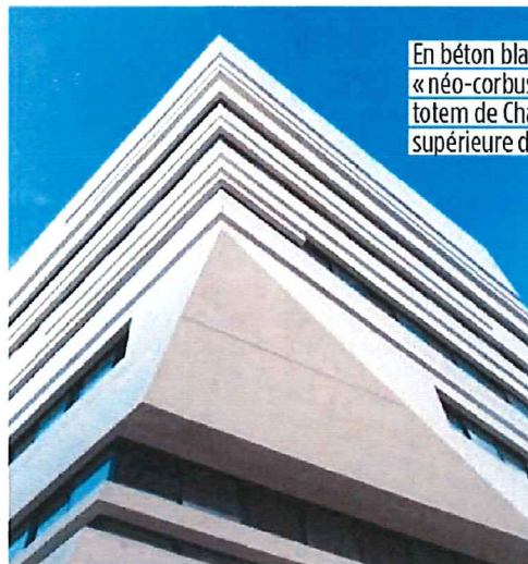
En béton blanc à pan coupé «néo-corbuséen», le bâtiment-totem de Chalucet accueille l'École supérieure d'art et de design.