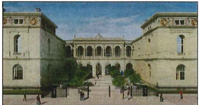
Une esquisse (non contractuelle) du Musée d'art tel qu'il s'offrira aux Toulonnais, à l'automne 2019. (Repro DR)

1. Une enveloppe de 10 millions d'euros est consacrée à la rénovation du Musée et de la bibliothèque attenante.