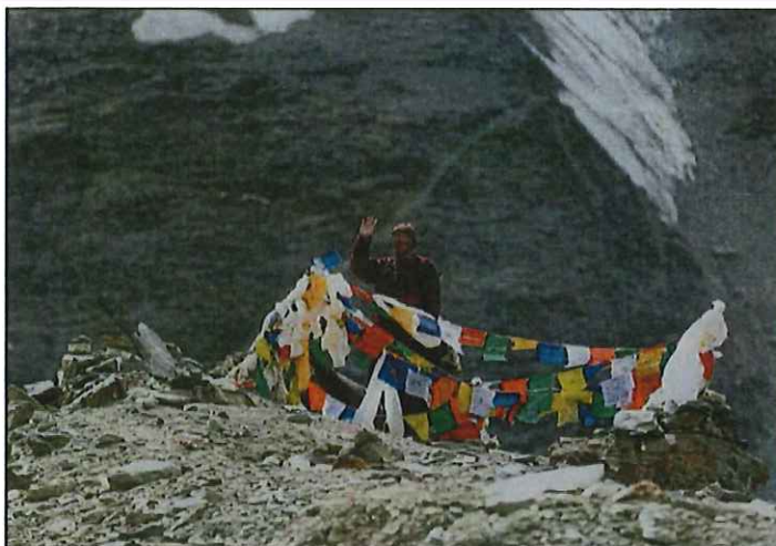
Le prix spécial du jury revient à Une route pour Kargiak , réalisé par Jean-Michel Corllion.