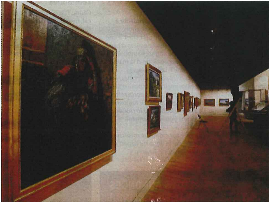
Les techniciens s'affairent à régler l'éclairage des salles du MAT. Dernières finitions avant l'ouverture au public.