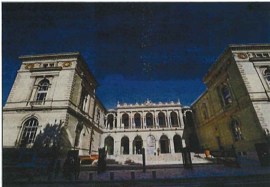
Les travaux reprendront en mars pour achever les dernières salles d'ici l'été 2020.