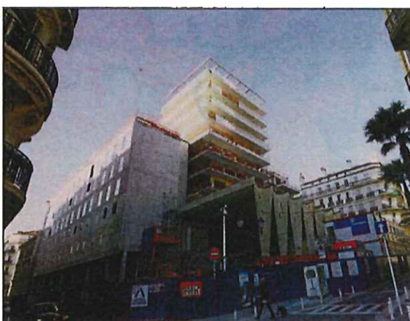
Le bâtiment définitif est prêt. A l'intérieur, les ouvriers s'activent.