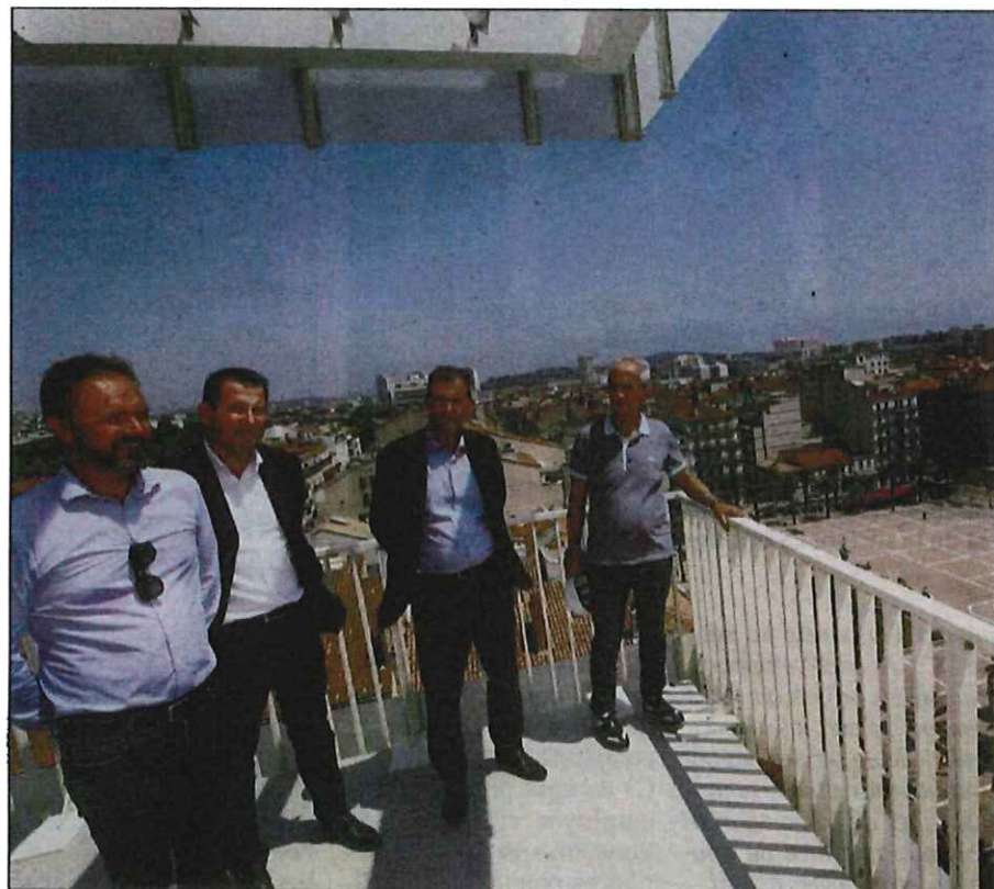
Les responsables du projet et Hubert Falco, maire de Toulon et président de la Métropole, ont fait une visite d'étape. Délais respectés.