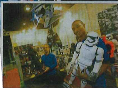
Petits et grands peuvent trouver de quoi s'amuser durant trois jours de jeu.