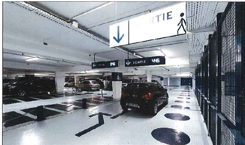
Un décompte désormais précis de l'occupation des places.

Engagé dès 2018, le chantier, sous la maîtrise d'ouvrage de Q-Park, étalé sur deux ans et demi, et mené en plusieurs étapes sur les dix parkings de la ville, a été réalisé par 60 % d'entreprises locales. Ce chantier hors norme s'est déroulé en exploitation. Une problématique qu'il a fallu prendre en compte. « Nous avons essayé de maintenir une capacité de stationnement au maximum malgré les travaux », commente Guillaume Arqué. Nous avons conscience que cela a engendré des problé-