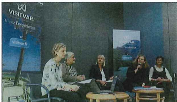
Var Tourisme prépare sa saison.