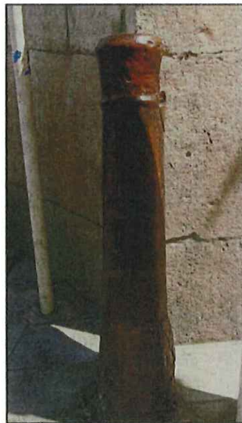
Le canon sert aujourd'hui de chasse-roue.

La rue Pierre-Semard, – baptisée ainsi en 1945 du nom d'un cheminot et Résistant fusillé par les Allemands –, était autrefois appelée rue du Canon. En référence au canon qui se dresse au bout de l'avenue, au croisement de la rue Anatole-France.