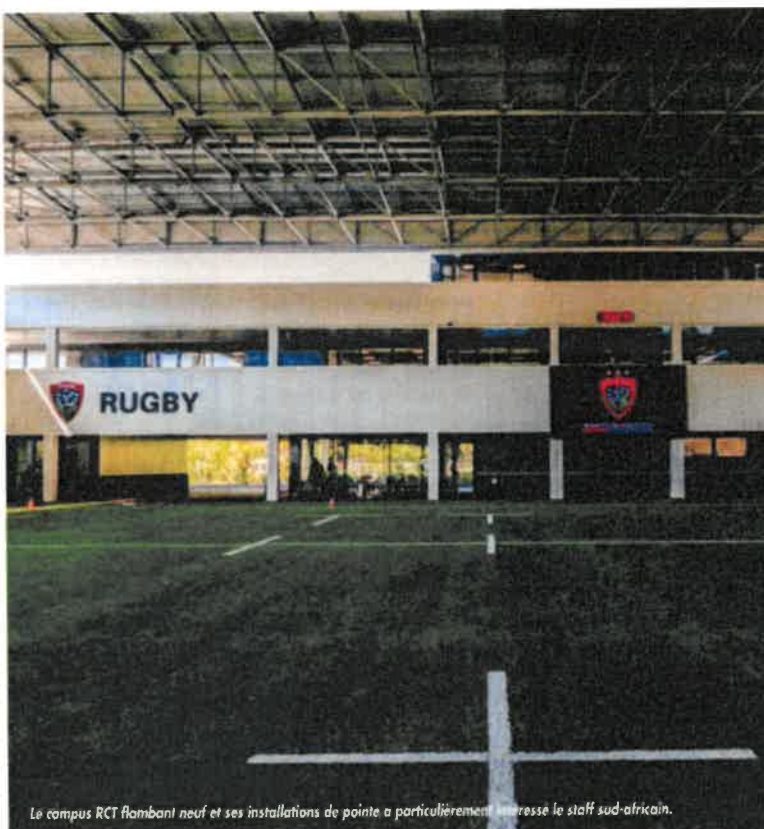
Le campus RCT flambant neuf et ses installations de pointe a particulièrement intéressé le staff sud-africain.

Au-delà de cette belle annonce pour le territoire de la Métropole TPM, c'est toute la région qui va vibrer au rythme du rugby dans un