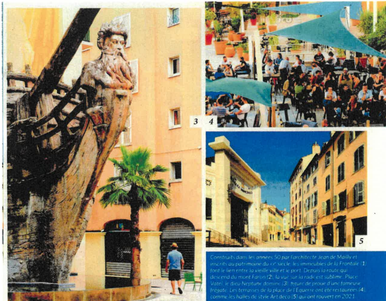
Construits dans les années 50 par l'architecte Jean de Mailly et inscrits au patrimoine du xix e siècle, les immeubles de la Frontale (1) font le lien entre la vieille ville et le port. Depuis la route qui descend du mont Faron (2), la vue sur la rade est sublime. Place Vatel, le dieu Neptune domine (3) figure de proue d'une fameuse frégate. Les terrasses de la place de l'Équerre ont été restaurées (4) comme les halles de style Art déco (5) qui ont rouvert en 2021.

don, un de ces « trous de bombe » hérités de la Seconde Guerre mondiale. Et personne ne s'aventurerait plus dans l'attendant rue Pierre-Semard, surnommée « Chicago ». Celle-ci traverse aujourd'hui le quartier des Arts, où l'on déambule à pied entre boutiques de créateurs, cafés et galeries, comme celle de Monsieur Z, qui signe des affiches de la Côte d'Azur délicieusement vintage. Mais qu'est-il arrivé à Toulon, ce port militaire du Var boudé des touristes entre Nice et Marseille, plutôt mal famé, empêtré dans les embouteillages, coincé entre mer et montagne ?