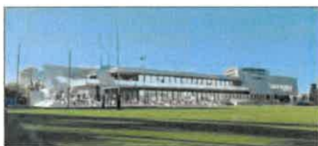
Coût total du projet : 6,6 millions.

Le campus du RCT va bientôt avoir son club-house à domicile. D'ici l'été prochain, NGE Bâtiment se charge de réaliser, sur trois niveaux et ouvert sur la pelouse, un lieu de réception et d'événements pour les institutionnels, les invités et les fans. Restaurant XXL, bar, salles de séminaires et bureaux : le nouveau complexe rouge et noir devrait être livré pour l'été prochain et bé-