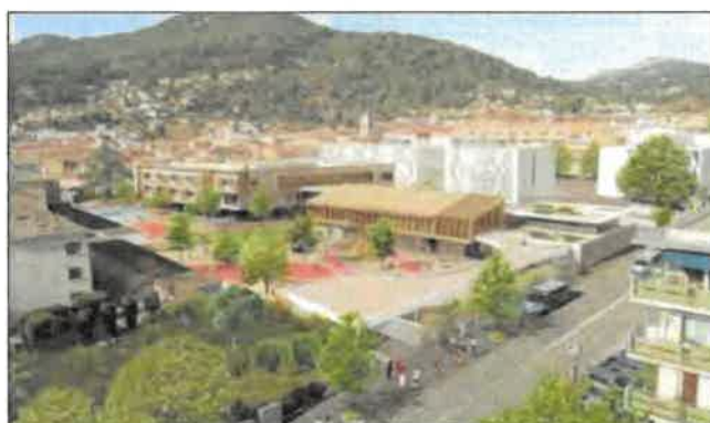
Les premiers bâtiments devraient être livrés en février.

les des écoles Villon et Anatole-France devraient découvrir leur nouveau bâtiment, à la pointe de la modernité. L'ensemble de l'opération (qui concerne également les écoles Ferry et Fabié en centre-ville, Pagnol et Mistral à La Coupiane) sera, lui, achevé en 2024.