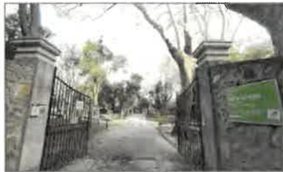
Le parc s'étendra sur 2 hectares.

Dans une démarche de « reconquête paysagère », la Ville s'attaque, cette année, à l'agrandissement du parc du Pré Sandin, à Saint-Jean-du-Var. Objectif : s'étendre sur 3 000 m 2 supplémentaires, pour atteindre 20 000 m 2 au total. Son extension va être densément boisée et faire l'objet d'un aménagement destinée à séduire les promeneurs et riverains. Une fontaine sèche à cinq jets sera également créée.